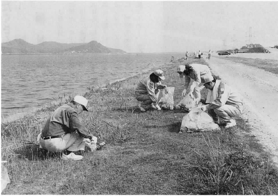
▲遠賀町では、さまざまな企業やボランティア団体が、ゴミの回収活動を行っている。 しかし捨てられるゴミは後をたたない。

ゴミがひとつも落ちていない町、清潔で美しい遠賀町をめざし、町ぐるみで環境の美化に取り組むための「遠賀町環境美化に関する条例」が施行されて一年が過ぎました。