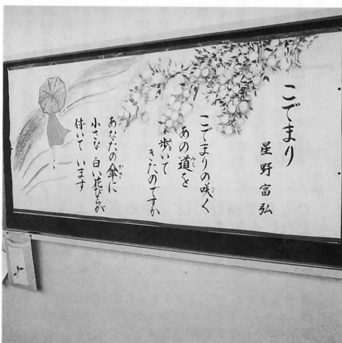
▲島門小学校校長室前に掲げられている詩

詩というのはいろんな人に、いろんな想像を生むものだと思います。これからも、たくさんさんの夢が生まれるような詩を児童にみせてあげてください。卒業後、小学校に寄ってよかったです。