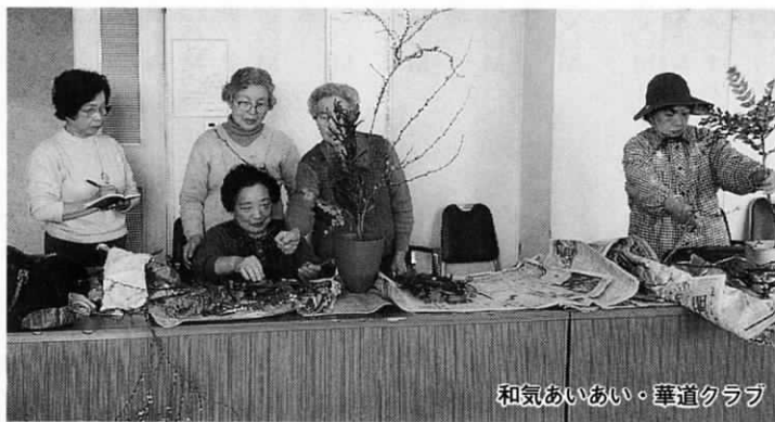
和気あいあい。華道クラブ