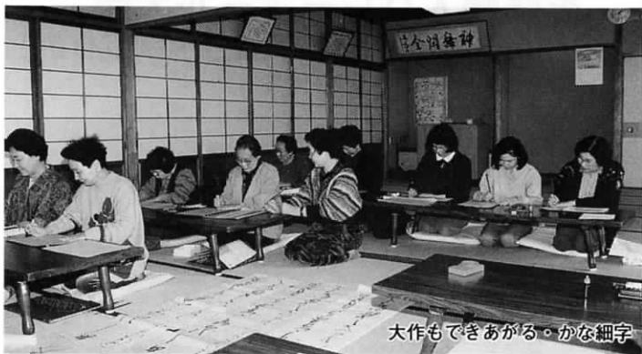
大作もできあがる。かな細字

遠賀町内で、積極的にサークル活動が展開されている中央公民館をはじめとして、地域の公民館、遠賀コミュニティセンター、ふれあいの里センターなどは、心に豊かさをと、「生きがいづくり・生涯学習」に励む、町民のみなさんでにぎわっています。 前号で、ふれあいの里センターでの『生きがいづくり・生涯学習』をご紹介しますので、この号では、