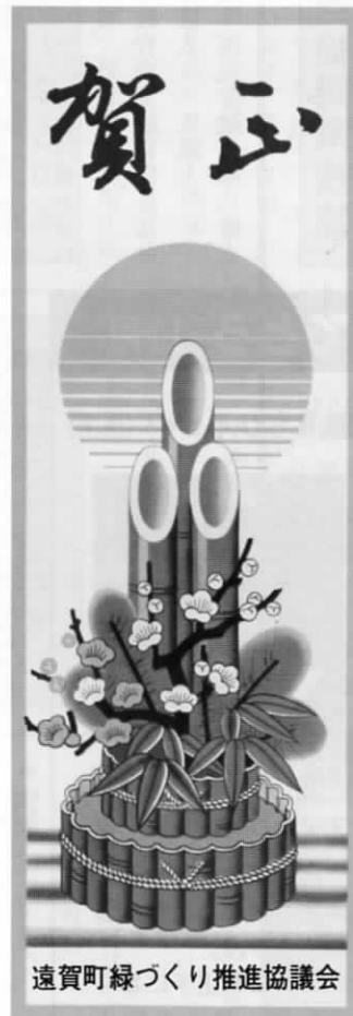
遠賀町緑づくり推進協議会

●期限 12月20日 遠賀町緑づくり推進協議会では、緑化保護のため「門松カード」の販売を行っています。ご希望の方は、遠賀町役場産業課窓口にてお求めください。