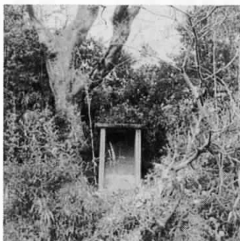
薬師堂の西を下りたところにある井戸