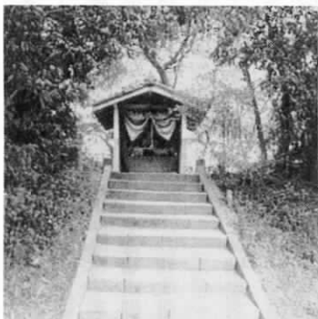
堂塔寺あとにある薬師堂