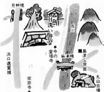
●鳥津橋より北へ150m、階段登って薬師堂の西を10m下りる。