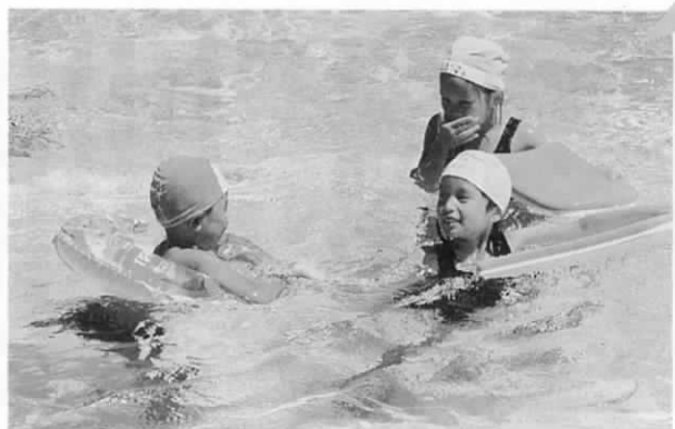
(写真の元気な笑顔は8月3日 広渡小プールでのスナップです)