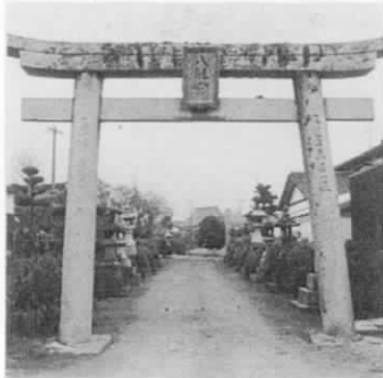
八剣神社大鳥居と参道