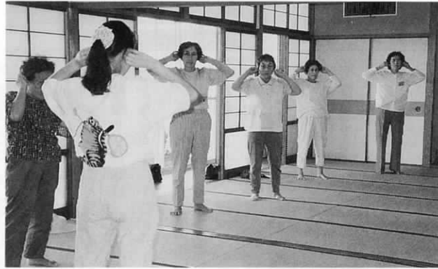
先生の指導で、初めて気功に取り組んだ人も、その雰囲気にとけ込んで「ずっと続けてみたい」…気功コース