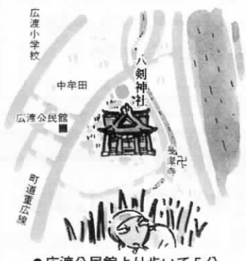
●広渡公民館より歩いて5分