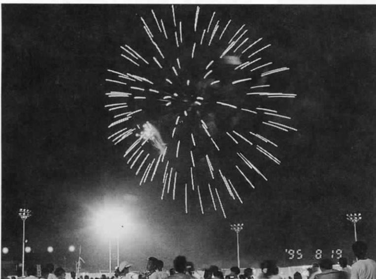
大会の最後を飾った花火