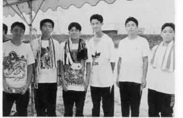
大会を支える ウォーターマン