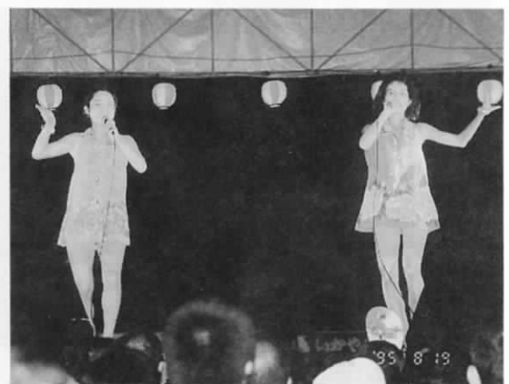
「キャメル」によるアトラクション