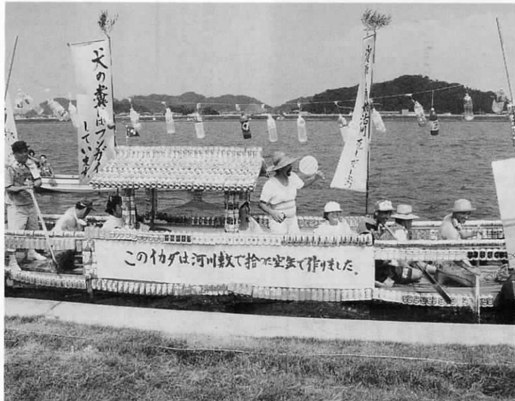
アイディアイカダ部門で優勝した広渡青少年号 遠賀川河川敷で拾ったあき缶約3000コで作りました。

町民レガッタ（地区対抗男子）①今古賀②島津③東和苑（同女子） ①尾崎②上別府③別府（オープン男子）①消防署B②消防署A③遠賀自動車学校（同女子）①遠信ガールズ②新町マミーズ③ミセスグリーン アイディアイカダ競技①広渡青少年号②遠賀ドーム号③大相撲遠賀場所土俵船