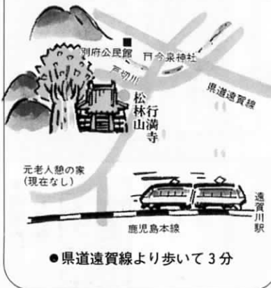
●県道遠賀線より歩いて3分