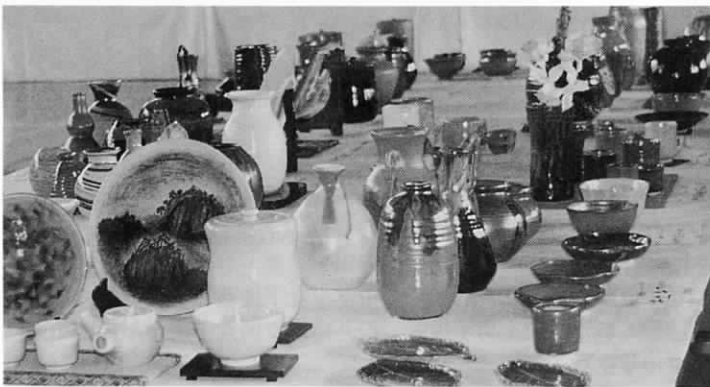
昨年、体育センターを飾った作品の かずかず（写真は陶芸作品）

遠賀町文化祭について、くわしくは、10月25日発行の広報「おんが」と同時発行の「文化祭のご案内」をご覧ください。また、中央公民館へお問い合わせください。