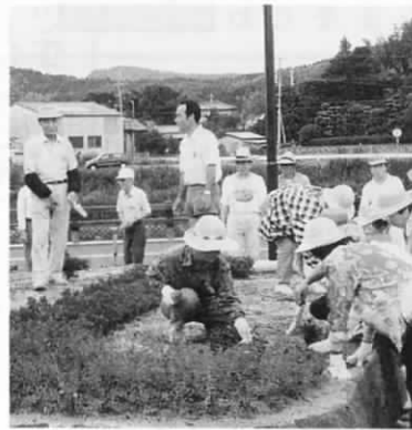
「趣味の園芸学級」のみなさんがふれあいの里で、草花の植えつけ

ばと、この「いきいきふれあい学級」は、みなさんの学習意欲に支えられ、所期の目的をクリアー、今後の学習の広がり期待されています。