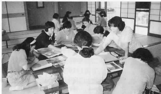
制作活動に熱中——参加のみなさん

講座の終了とともに、読書ボランティアグループ『おいもの会』が誕生、制作活動や実践活動を、早速始められ、今後のボランティア活動が大いに期待されています。