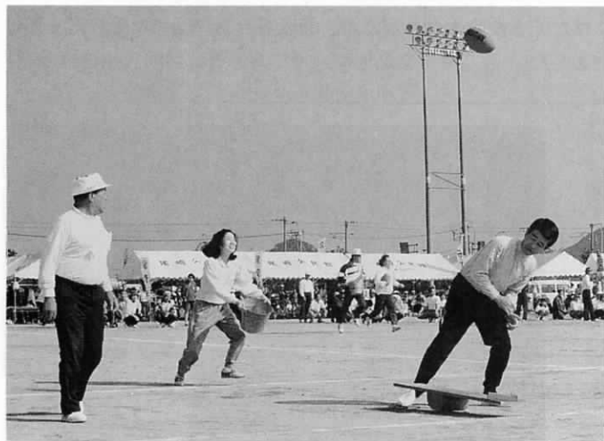
ラグビーボールを板ではね上げ バケツでキャッチします。 「ナイスキャッチ」