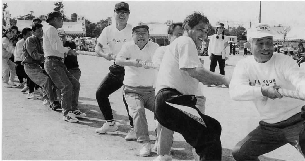
人気種目「綱引き」 各区とも力を合わせて がんばりました。