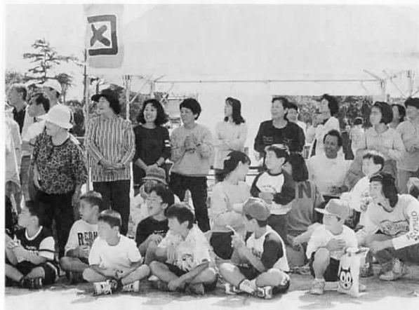
応援にも熱が入ります。