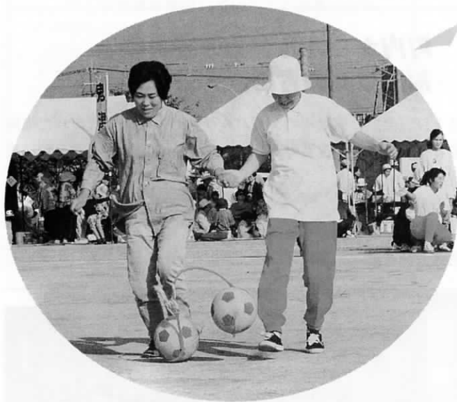
「ボールけり」 サッカーボールを各々袋に入れ結んだ ものを2人1組でけります。 なかなか思ったようには転がらないよ うです。