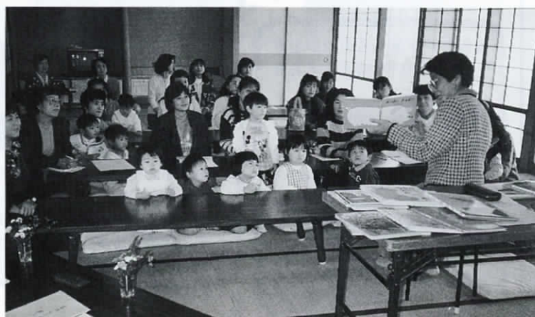
子どもといっしょに楽しみました (第5回)