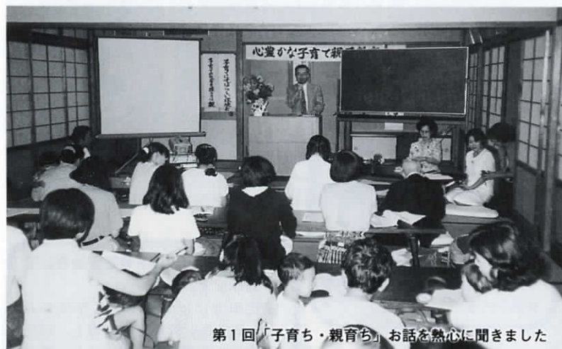
第1回「子育て・親育ち」お話を熱心に聞きました