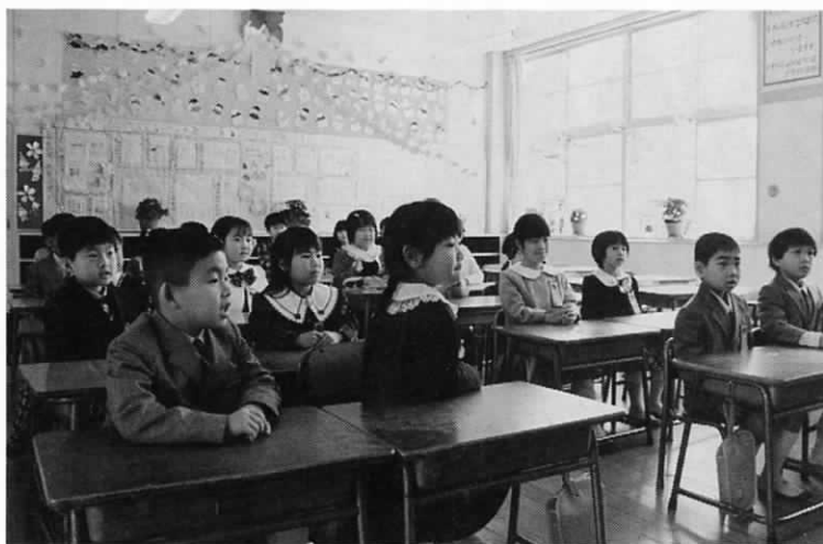
▲さあ今日から一年生 (平成7年度 浅木小入学式にて)