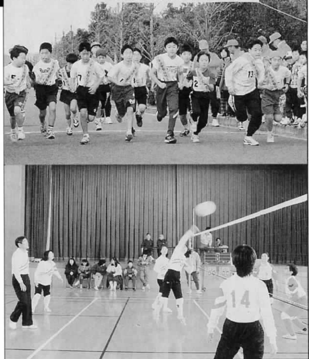
遠賀町少年少女駅伝競争大会 主催 遠賀町体育協会・主管 遠賀町少年スポーツクラブ