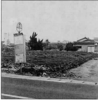
現在の虫生津のバス停