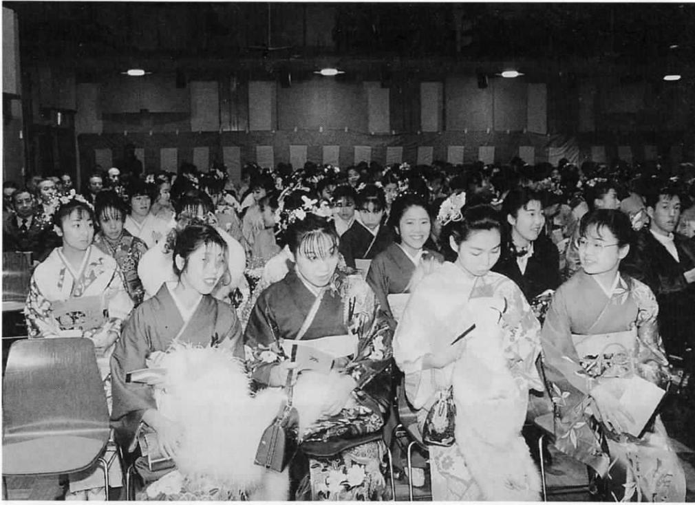
▲新たに315人が大人の仲間入り