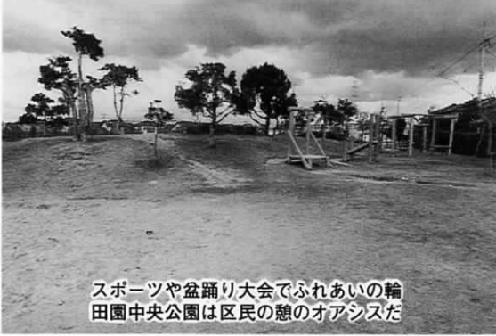
スポーツや盆踊り大会でふれあいの輪 田園中央公園は区民の憩いのオアシスだ