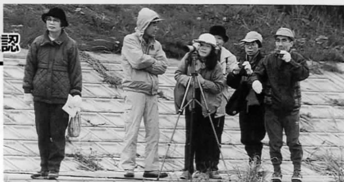
冬の遠賀川河川敷で、約30人がふるさとの自然を満喫

遠賀レクリエーションの会の主催で12月4日、バードウォッチングが行われました。めずらしいカワセミを見つけた子どもは、「あっ、あの鳥まるで青い銀紙みたいだね」とポツリ。これには、指導にあたった日本野鳥の会の会員も「子どもの表現力ってすごい」と感心しきり。