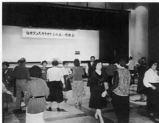
遠賀町ふれあい学習

「町民学習ネットワーク事業」の楽しい学習活動の広がりとふれあいを深めようと、社交ダンスとカラオケの学習グループがいっしょになっ