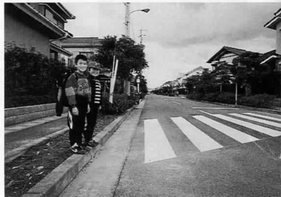
それぞれの世帯の生け垣のほか、街路樹も豊富。「緑の町」は区の名刺

田園——その名のとおり、緑にあふれる地区。遠賀町の自然の緑に、地区内の緑が見事にマッチ。これは、町内のどの地区にもない特徴です。その秘密は、地区内で結ばれた緑化協定にあります。この協定は、宅地内の境界線をブロックではなく、生け垣を整備するなどを取り決めたもので、緑の町づくりに一役かかっています。特に、4月から6月にかけてのサクラヤツツジの