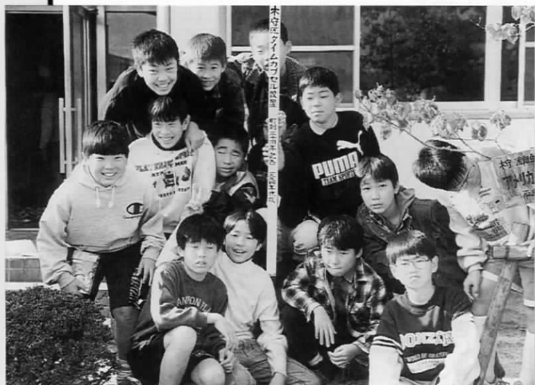
区内の小学5・6年生が代表してカプセルを埋めた 10年後は、みんなすてきな青年になっていることでしょう