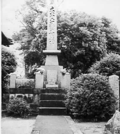
▲大東亜戦争慰霊塔

区の中心部に牟田神社と尾崎公 民館があります。同じ敷地内に大 東亜戦争慰霊塔が建てられていま す。当時の尾崎区はわずか六十戸 余り。その中から戦争に参加し帰 らぬ人となった尊い二十柱の犠牲 者が祭られています。8月13日の