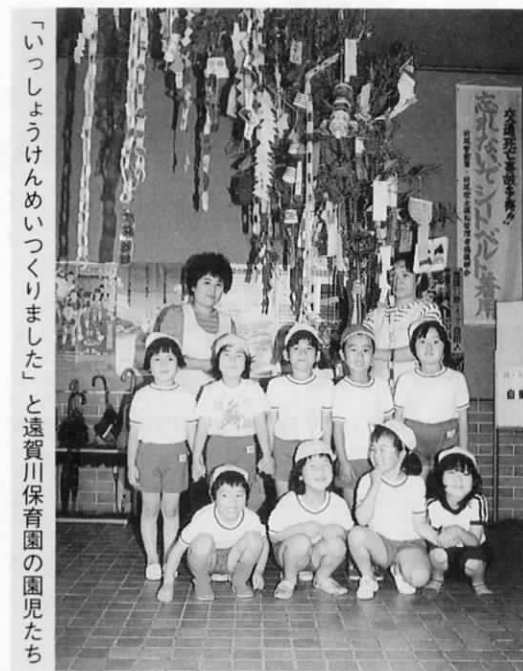
「いっしょけんめいづくりました」と遠賀川保育園の園児たち

七夕の飾りといえば、折り紙などを使うといったイメージが強いのですが、遠賀川保育園のみんなの飾りは、廃品を利用したもの。卵のパックやアイスクリームの容器などに思い思いの色をつけ、きれいに飾られています。使い捨て時代と呼ばれる今、「物の大切さ」を七夕の飾り一つからも身につけます。その気持ちを大人になっても忘れないでね。