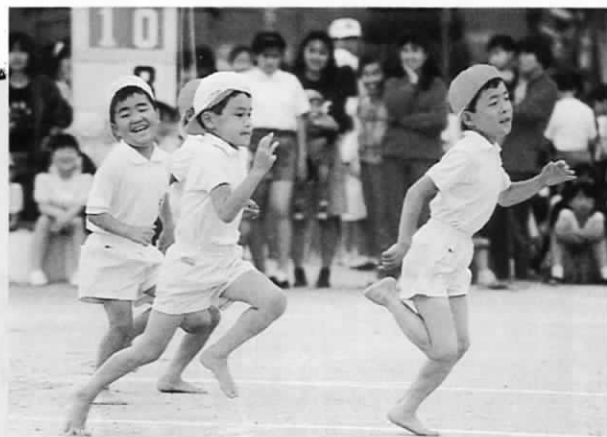
ゴールをめざして力走 (島門小学校で)