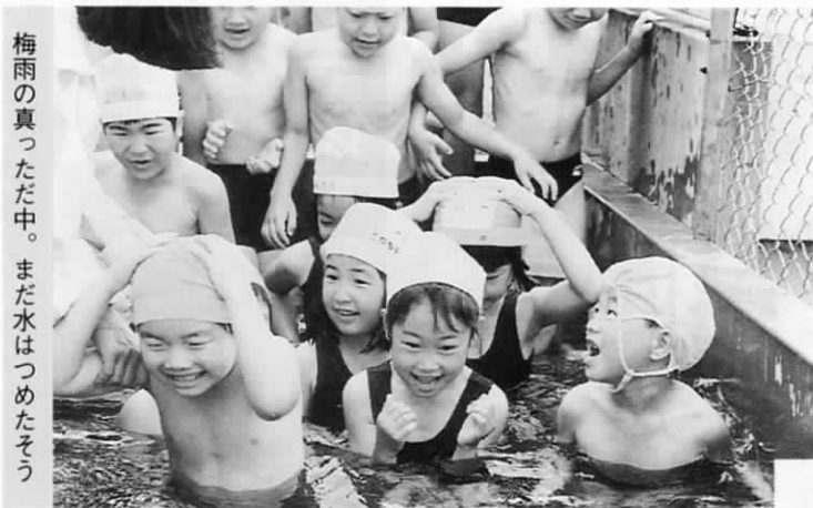
梅雨の真ただ中。まだ水はつめたそう