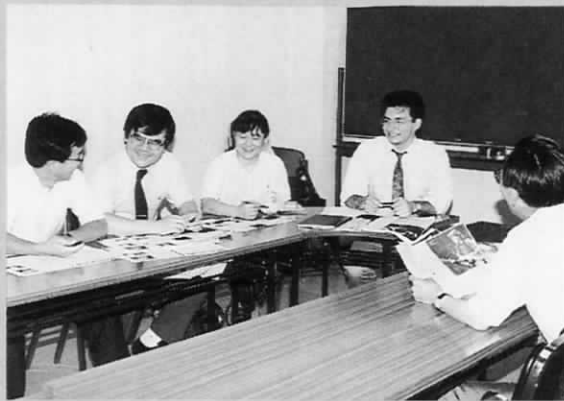
和気あいあいと英会話を学びます (中央公民館で)

こんな『ふれあいの輪』が町内に どんどん広がってくれたらいいですね すでに始まっています。「町民学習ネットワーク事業」