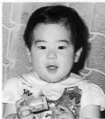
(信秀)さん長男 平成4年7月4日生