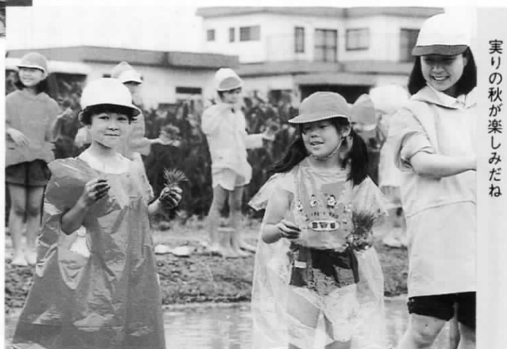
実りの秋が楽しみだね

これからが夏本番。水と接する機会も増えます。先生の言うことをよく聞いて、水の事故にはくれぐれも注意してください。それと、水に入る前には、準備運動も忘れずにね。