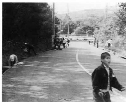
町道友田線の清掃作業

く、町の美化推進活動も積極的 です。毎月一回、区の全世帯が参加 して、地区内道路の一齐清掃を 行っています。区内には国道3号 線や町道山手線など交通量の多い