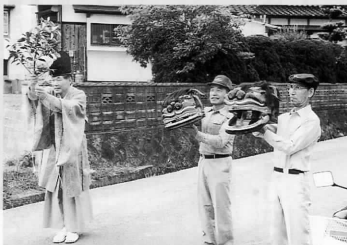
無病息災を祈り、獅子のあごが合わされます

「最近では、お正月でも見ることが少なくなった獅子舞の獅子がお目見え」これは、6月6日に木守で行われたお獅子祭でのことです。