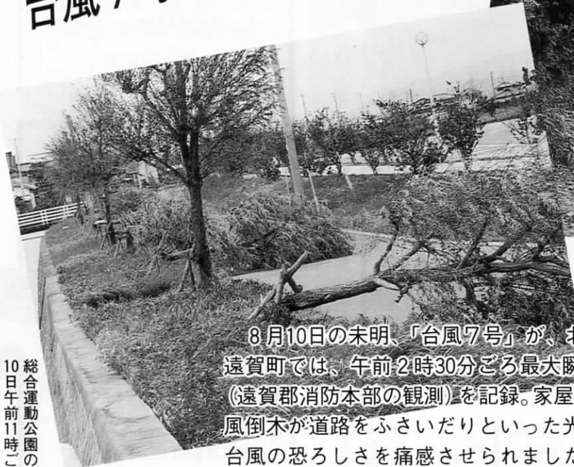
10日午前11時ごろ 総合運動公園の街路樹もこのとおり