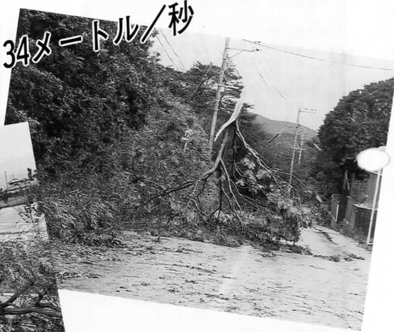
10日午前10時ごろ尾崎区で 風倒木が町道をふさぐ

8月10日の未明、「台風7号」が、北部九州を襲いました。遠賀町では、午前2時30分ごろ最大瞬間風速34メートル/秒（遠賀郡消防本部の観測）を記録。家屋の屋根瓦が吹き飛んだり、風倒木が道路をふさいだりといった光景が見られ、あらためて台風の恐ろしさを痛感させられました。被害に遭われた皆様には、心からお見舞い申し上げます。