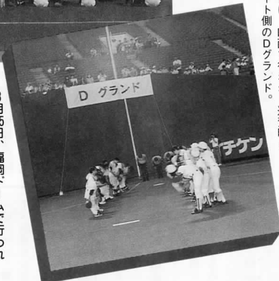
試合は、四面で行われ、遠賀町は、ライト側のDグラウンド。

8月25日、福岡ドームで行われた福岡県小学生ソフトボール大会に、町内のソフトボールチームの代表三十人が参加しました。これは、「子どもたちに夢のプレセントを」と、福岡県町村長会が開催したもので、選手たちは、憧れのドームでプロ野球選手の気分を満喫しました。 大会は、「思い出づくり」が目的のため各チーム一試合のみ。遠賀町は宝珠山村と対戦し、圧倒的な強さで試合をものにしました。「トーナメントだったら、もっとたくさん試合できたのに……」ちょっとびり残念だったけど、すてきな思い出をつくれた。そんな一日になりました。