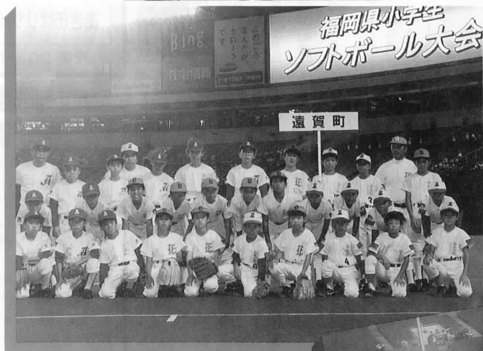
ドームで記念撮影。気分は、プロ野球選手。