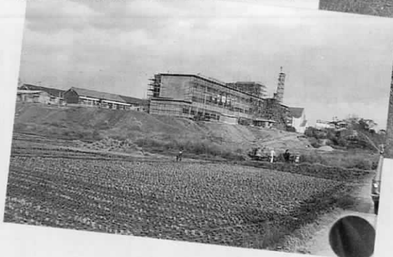
現校舎建築中の遠賀中学校。 後ろに旧木造校舎が見える。(昭和40年ごろ)