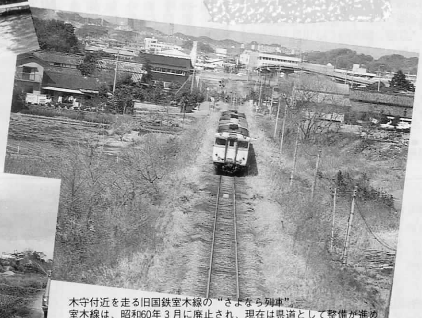
木守付近を走る旧国鉄室木線の“さよなら列車”。 室木線は、昭和60年3月に廃止され、現在は県道として整備が進め られている。