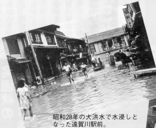
昭和28年の大洪水で水浸しと なった遠賀川駅前。

古いアルバムをちょっとだけ開いてみてください。ゆつたりと、 時が流れていた、“あそこ”の名場面はありませんか。企画調整 係では昔の写真を探しています。家庭でのスナップ、お祭り、風 景など、昔の遠賀町を物語る写真ならどんなものでも構いません。 企画課企画調整係 ☎(293)1234へご一報ください。