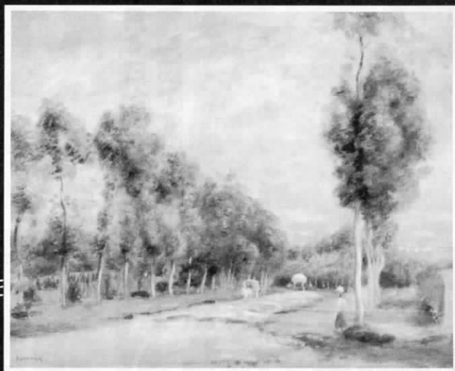
ルノアール「ヴェルサイユからルーヴシェンヌへの道」1895年