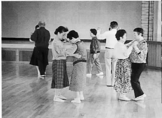
木守老人クラブ朝日会のみなさんは社交ダンスを楽しんでいます