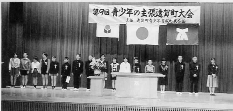
17人の参加者が 舞台上に勢ぞろい

10月23日、遠賀町中央公民館で青少年の主張遠賀町大会がありました。これは、遠賀町青少年育成町民会議の主催で毎年行われているもので、今年で九回目になります。大会には、町内の小学6年生から高校3年生までの17人が参加。自分たちが日ごろ考えていることをうまくまとめ、多くの人が見守るなか、すばらしい主張を披露しました。