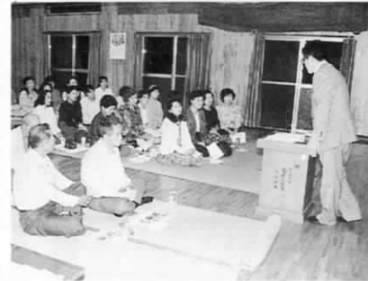
少年や防犯の勉強会が行われた10月16日

の人は、暗い夜道の通行を余儀なくされています。そこで区では、「自分たちの地区は自分たちの手で守ろう」と自ら単独で危険な場所から順番に街灯を設置しているそうです。