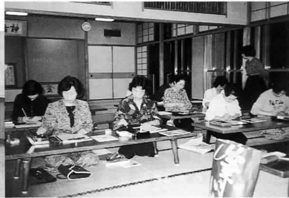
町内の友達どおしのあつまり“コスモスの会”は習字で“生きがい学習”をしています。