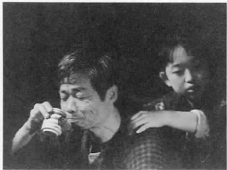
劇団やしやぶしによって上演される水上勉氏原作の戯曲『釈迦内枢歌』のシーン。必見の価値があります。