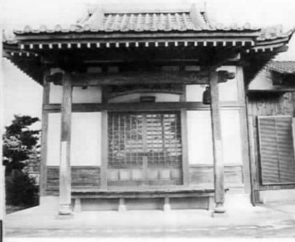
松風山延命庵（地藏堂）

総面積二十二・一四km 2 『水と緑』多くの自然につつまれたわたしたちの町。現在二十四の行政区があり、それぞれの地区にも、素敵な場所、話題になることなどたくさんあるはず。このシリーズは、そんな素晴らしいふるさと「おんが」を紹介するページです。