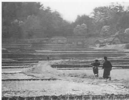
映画『橋のない川』のポスターから