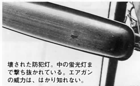
壊された防犯灯。中の蛍光灯まで撃ち抜かれている。エアガンの威力は、はかり知れない。

防犯灯は、「暗い夜道を通行する人たちにほんの少しの勇気を与えてくれる」そんな不思議な力を持っているのではないのでしょうか。そしてなにより、町民の生命と財産を守るための大切なものです。このようないたずらは絶対に許されることはありません。もし、不審な人物を見かけたら、警察または、福祉課地域改善係へご連絡ください。