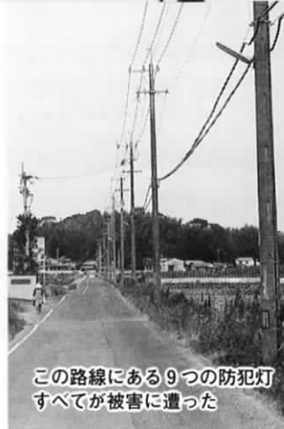
この路線にある9つの防犯灯すべてが被害に遭った