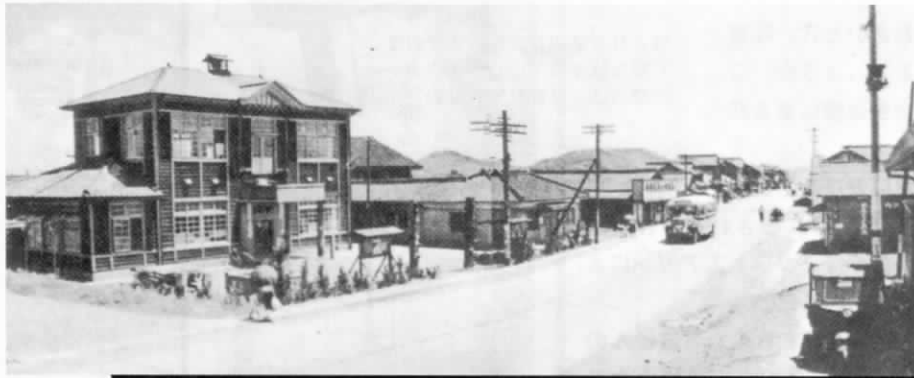
昭和30年ごろの、遠賀村役場（左の建物）とその周辺の様子。役場は昭和47年に移築されるまで、現在の遠賀川郵便局の場所にあった。40年の時の流れを感じさせる1枚の写真。