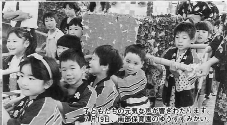
子どもたちの元気な声が響きわたります。7月19日、南部保育園のゆうすずみかい。

役場の業務、年末は12月28日(火)まで、新年は1月4日(金)からです。皆様よいお年をお迎えください。