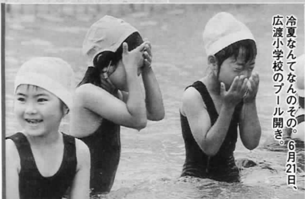
冷夏なんてなんのその。6月21日、広渡小学校のプール開き。