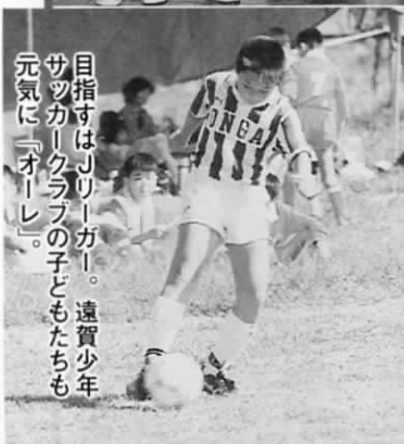
目指すは「Jリーグ」。遠賀少年サッカークラブの子ともたちも元気に「オーレ」。