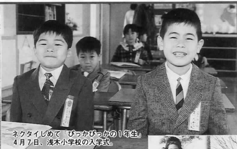
ネクタイしめて「ぴっかぴっかの1年生」 4月7日、浅木小学校の入学式。