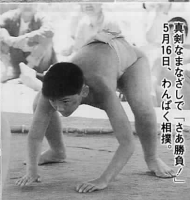
「真剣なまなざしで「さあ勝負！」 5月16日、わんぱく相撲。