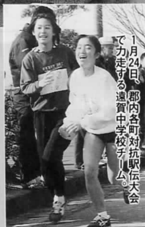
1月24日、郡内各町対抗駅伝大会で力走する遠賀中学校チーム。