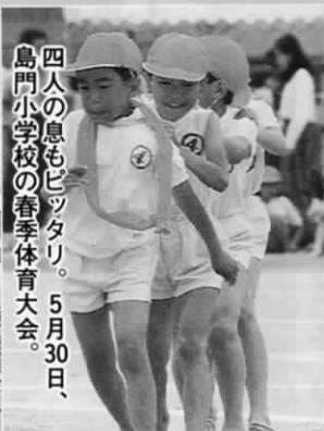
四人の息もピッタリ。5月30日、島門小学校の春季体育大会。