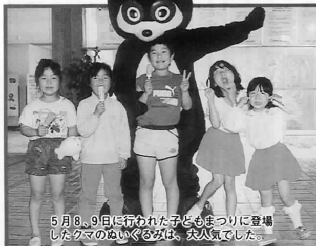
5月8、9日に行われた子どもまつりに登場したクマのぬいぐるみは、大人気でした。