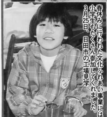
春休みに行われた文化ふれあい事業には小学生もたくさん参加してくれました。3月25日、日田市の工場見学。