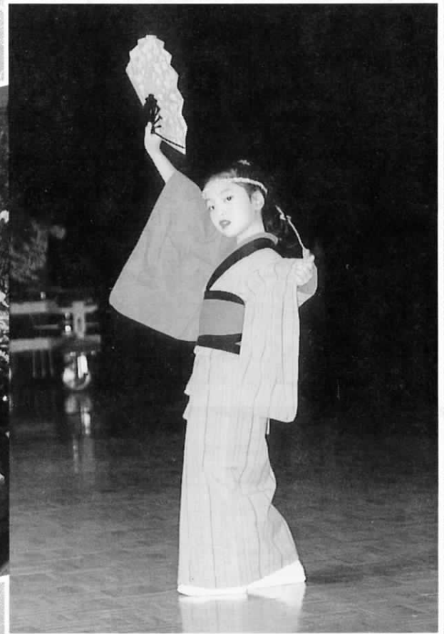
(写真は昨年の遠賀町文化祭から)