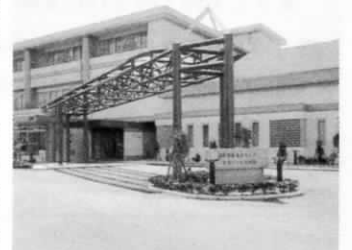
グリーンヒル若宮

●当選発表 3月下旬（予定）、直接本人に連絡します ●問い合わせ 福岡県民生部国民年金課指導係 ☎092（622）6399