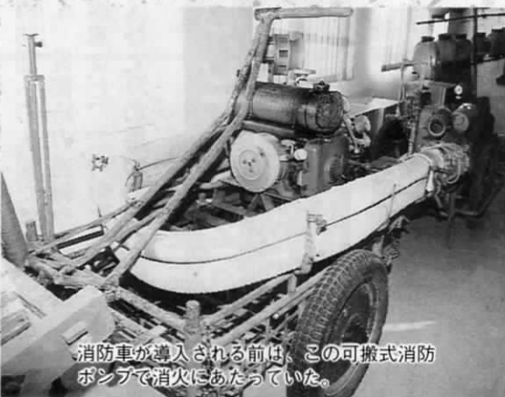
消防車が導入される前は、この可搬式消防ポンプで消火にあっていた。

昭和47年、7つの分団が3つの分団に統合。その3年後の昭和50年には、団員定数は120人から100人へと削減されました。さらに、昭和63年4月の条例改正により団員定数は84人（現団員数84人）となり現在に至っています。（参考文献 遠賀町誌）