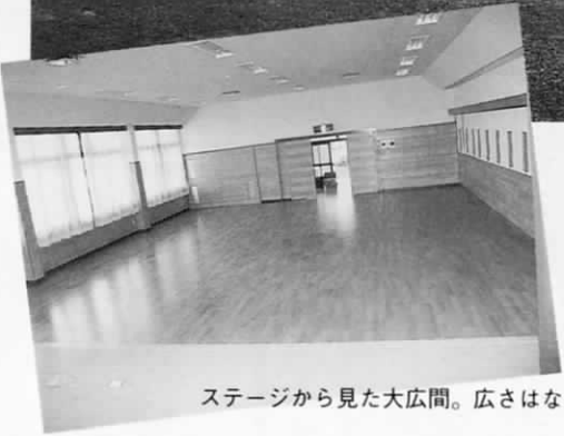
ステージから見た大広間。広さはなんと70畳。