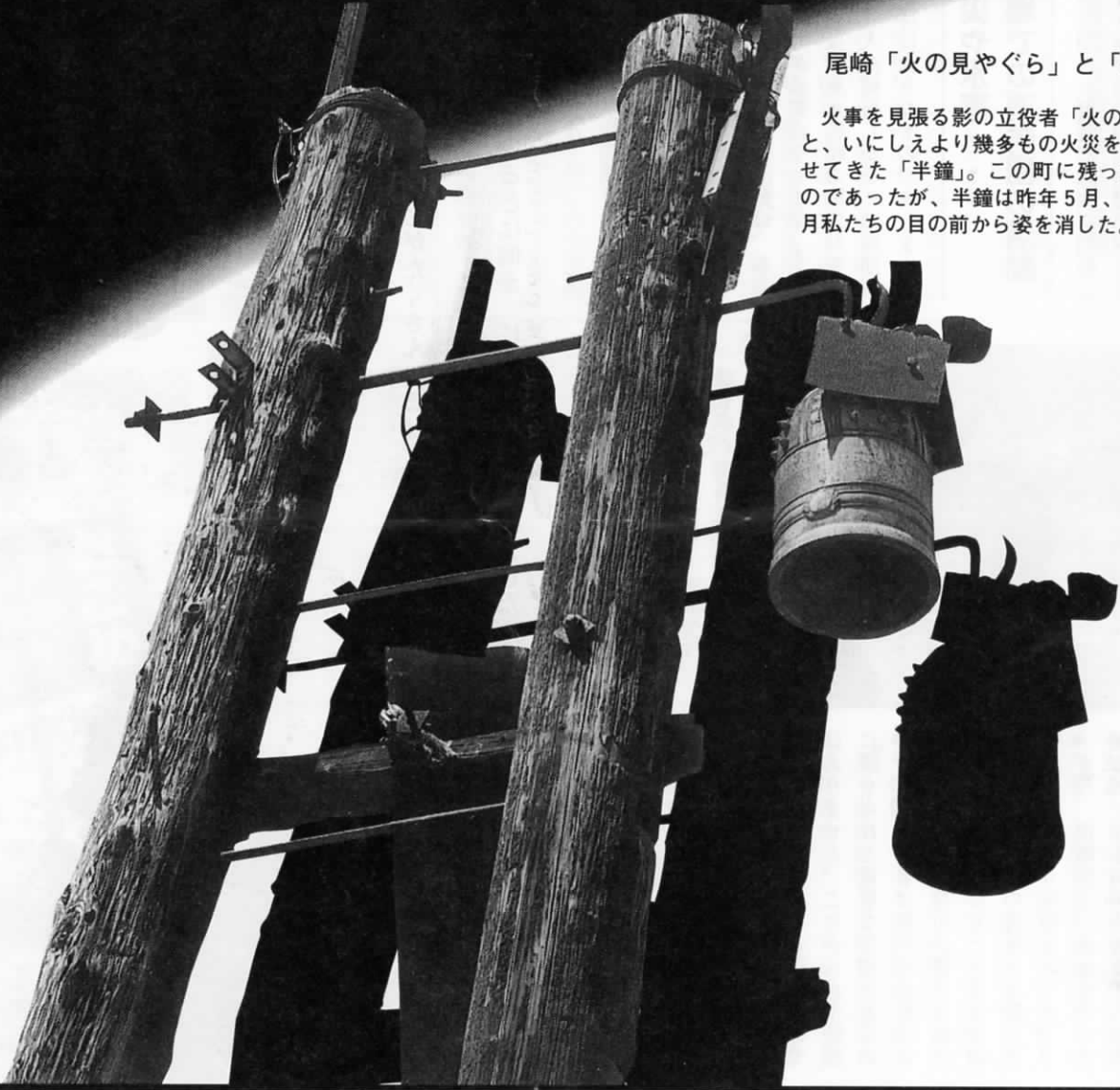
尾崎「火の見やぐら」と「半鐘」

消防記念日は、昭和23年3月7日に消防組織法が施行され、消防が、市町村が行う自治体消防として新たに出発することになったのを記念して設けられたもので、皆さんに「自らの地域は自らの手で火災その他の災害から守る」ということに対する理解と認識を深めていただくことを目的としています。