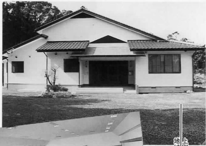
上別府公民館。地域活性化の拠点に。