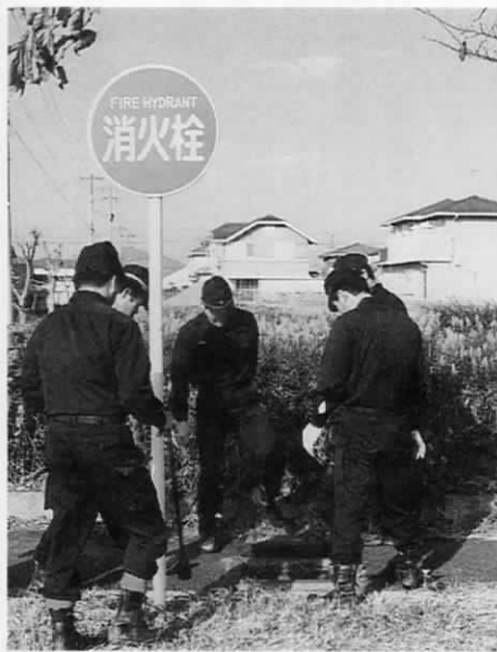
遠賀町消防団——安心の灯は消さない。春と秋の火災予防運動期間中には、町内の消火栓の点検を全団員で行っている。

期間中に行われる防火パレードや夜間、午後8時から午前0時まで、の年末特別警戒をはじめ、まさかの時のための県民火災共済の推進による防火意識の呼び掛け、消火活動を迅速、確実に行うためのポンプ車操法訓練や応援協定にもと