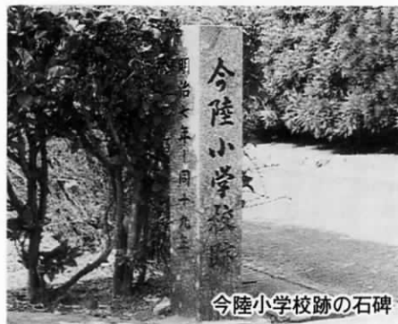
今古賀小学校跡の石碑

総面積二十二・一四km 2 『水と緑』多くの自然につつまれたわたしたちの町。現在二十四の行政区があり、それぞれの地区にも、素敵な場所、話題になることなどたくさんあるはず。このシリーズは、そんな素晴らしいふるさと「おんが」を紹介するページです。