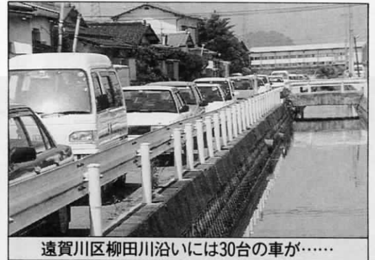
遠賀川区柳田川沿いには30台の車が……