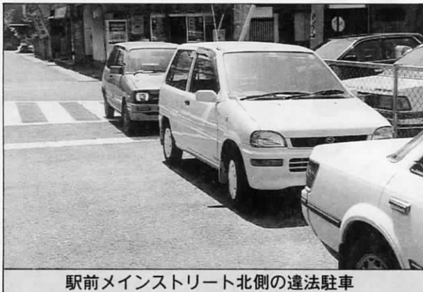
駅前メインストリート北側の違法駐車

福岡県警察では、6月を違法駐車取締り強調月間に指定しています。これに伴い、折尾警察署管内でも強力な取締りを実施中です。昨年の法改正で、違法駐車に対しては、反則金、違反点数なども大幅に引き上げられ、さらに悪質な違反常習者に対しては、車の使用を一定期間禁止するなどの措置ができるようになりました。交通の流れを乱し、事故発生の原因や緊急自動車、ゴミ収集作業活動を妨げる迷惑な違法駐車を一掃しましょう。