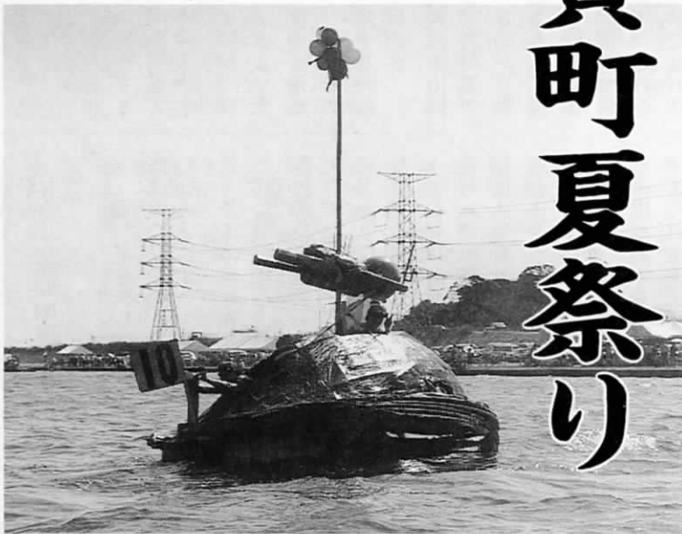
昨年の水上カーニバルの1コマ