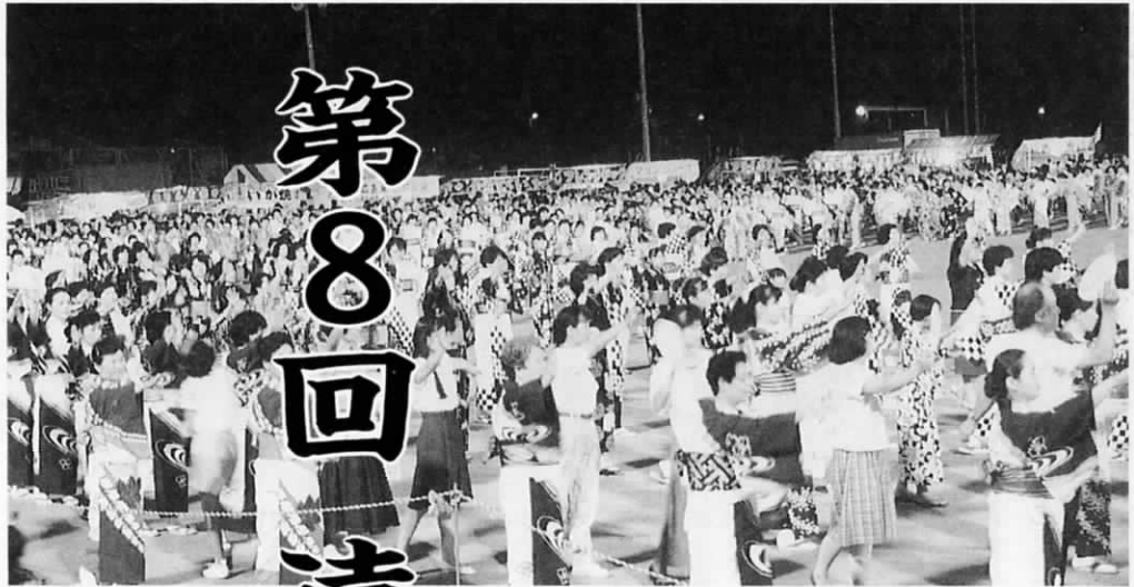
昨年の盆踊り大会“総踊り”