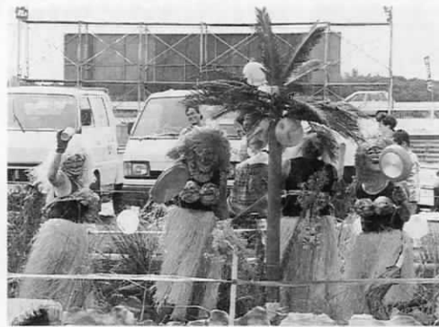
先頭バッテリーで楽しませてもらった浅木区のソング号