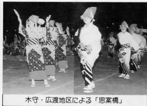
木守・広渡地区による「思案橋」

南部地区、北部地区それぞれの代表の木守、広渡による踊り「思案橋」では、両地区とも日頃の練習の成果をピタリ息の合った踊りで発揮してくれました。