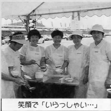
笑顔で「いらっしやい…」

大会本部近くの2つのテントでは婦人会の皆さんが、冷しぜんざい・トコロテンの無料サービスを行っていました。「どうぞ食べてください」とテントの中から大きな声！なかなかの評判でした。