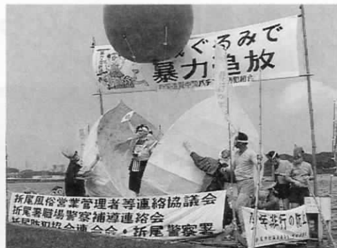
バックリと割れた巨大モモからアドバリンと桃太郎が……