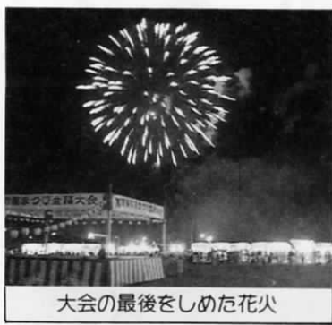
大会の最後をしめた花火

盆踊りの最後をかざる花火は、約千五百発が打ち上げられ「きれいなね」「これだけの花火が見られるならわざわざ遠くまで見に行かなくてもいいね」などの声があちらこちらから聞かれました。