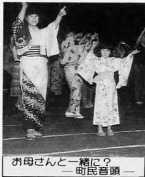
お母さんと一緒に? ー町民音頭ー

盆踊りの最後をかざる花火は、約千五百発が打ち上げられ「きれいなね」「これだけの花火が見られるならわざわざ遠くまで見に行かなくてもいいね」などの声があちらこちらから聞かれました。