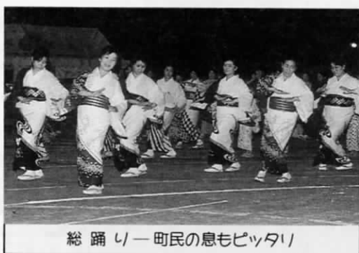
総踊りー町民の息もピッタリ

盆踊りでは、たくさんの方が輪になって地区ごとに揃いの浴衣、人それぞれに色鮮やかな浴衣を身にまとい、皆さん楽しそうに踊っていました。