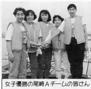
女子優勝の尾崎Aチームの皆さん