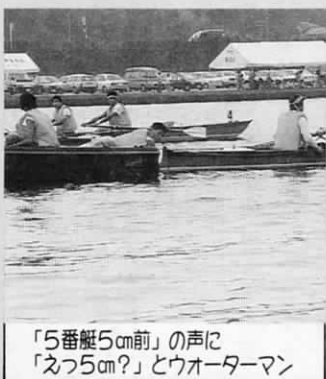
「5番艇5cm前」の声に「えっ5cm?」とウオーターマン

昨年からはまったレガッタ部門の進行は、漕艇知識のある人の力がどうしても必要になります。そこで、遠賀高校、東筑高校、八幡工業高校の漕艇部のみなさんが随所で活躍し、大会を支えてくれました。本当にお疲れさま!