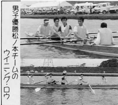
男子優勝松ノ本チームのウイニング・ロウ

午前中のレガッタ競技では、昨年以上の白熱したレースが展開され、ぐずついていた天気もこの熱気と大きな応援の声におさまれたのか次第に回復し、本来の夏空をとりもどしました。この夏空のもと午後からのアイデアイカダ競技では、趣向を凝らしたイカダ20艇が水面をにぎわし、夏のフィナーレを飾りました。