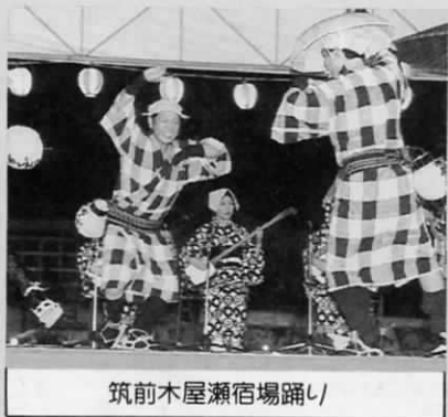
筑前木屋瀬宿場踊り

会場中央の舞台では、八幡西区 から参加の約20人の皆さんが福岡 県民俗無形文化財にふさわしい踊 りを披露してくれました。