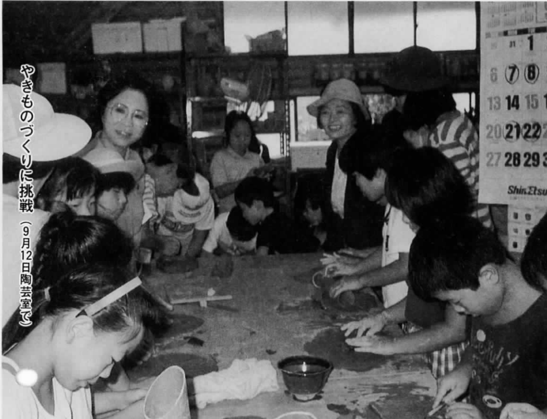
やぎものづくりを挑戦 (9月12日陶芸室で)

9月12日(土) 全国一斉に学校週五日制がスタートしました。この制度の開始日に遠賀町の子どもたちは、何をしてお過ごしのか町教育委員会が調査を行いました。この調査のねらい、結果、そして、その結果を基にした今後の対応についてお知らせします。