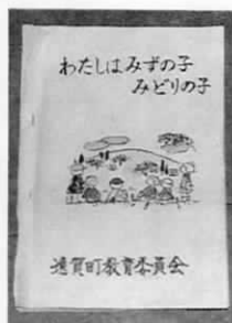
作成中のガイドブック

教育委員会では、「このガイドブックによって子供たちが、自身で第二土曜日の過ごし方を考え、実際に行動してくれれば。」と効果を期待しています。