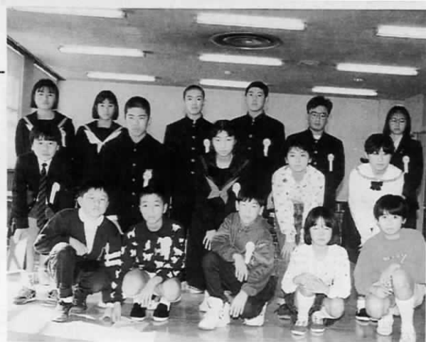
▶参加者のみなさん