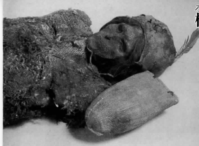
古ロブ・ノール人のミイラ (楼欄の美女)