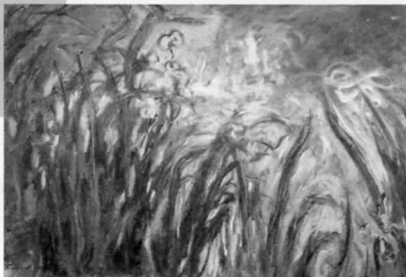
モネ〈黄色と薄紫のアイリス〉1924-25年/油彩