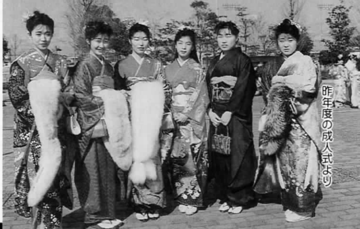
昨年度の成人式より