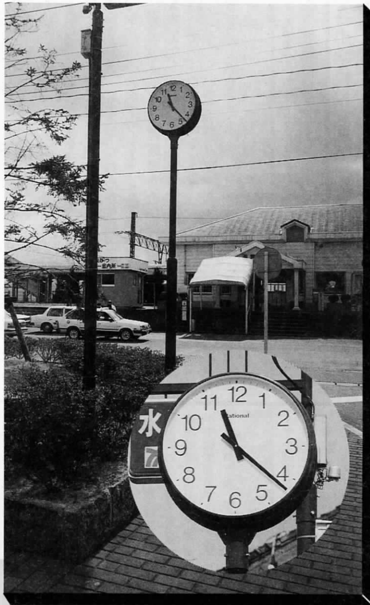
遠賀川駅前広場に時計塔!!

町の玄関口、遠賀川駅前広場でひとときわ目につく時計塔、もう、ご存じの人も多いと思います。この時計塔は、町内の有志二十人で結成されたキャッツ21のみなさんが、昨年末のチャリティ餅つき大会の売上金を充てて設置したものです。