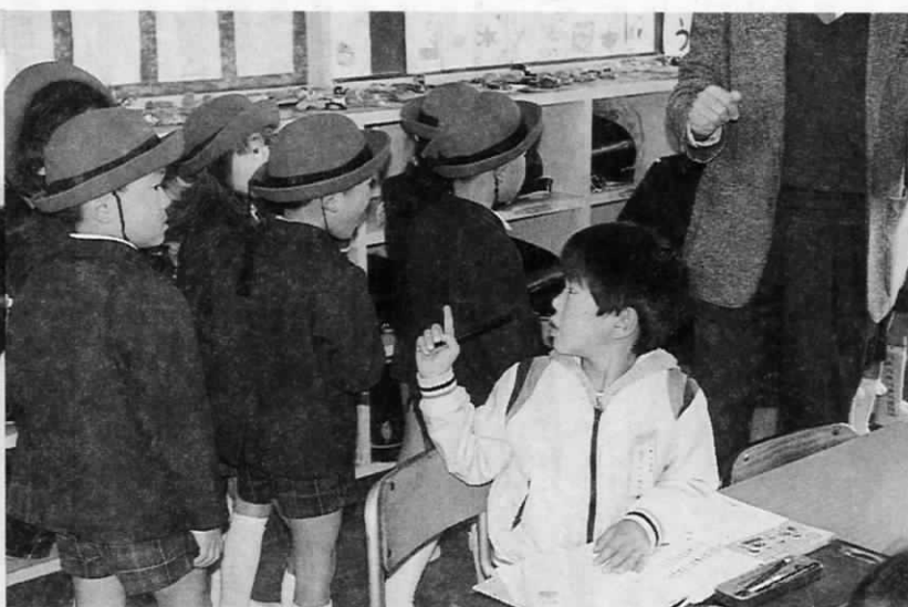
「しっかり、勉強するんだぞ！」と一年生のお兄ちゃん