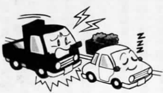
違法駐車をなくそう