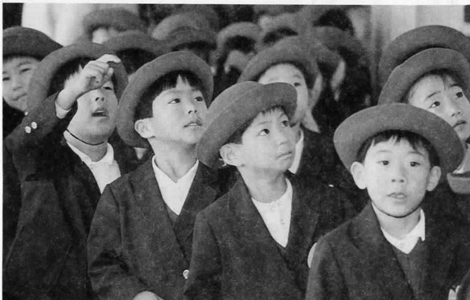
「へえー！ここが小学校か！」