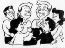
子供と高齢者の交通事故を防止しよう

新学期は、慣れない道を歩くようになった新入学児童や園児の交通事故が多発する時期です。ドライバーのみなさん、歩行者のみなさん、交通ルールを守り、交通安全に努めましょう。