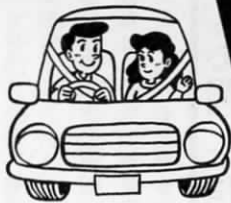
シートベルトの着用を徹底しよう