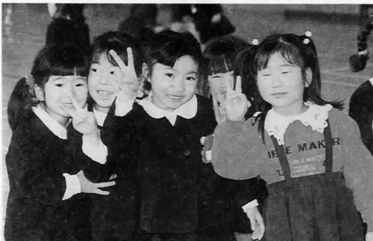
「早く来たいな。小学校って楽しそう」

今春、小学校入学予定の児童たちに学校の雰囲気になしでも慣れてもらおうと、2月23日と3月2日に町内の小学校で、新1年生一日入学がありました。