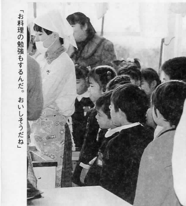
「お料理の勉強もするんだ。おいしそうだね」