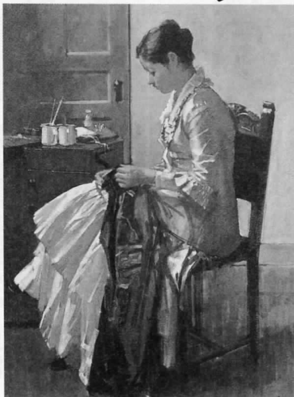
▲ 裁縫する女 1974年

小磯良平画伯が1988年12月16日に85歳で他界されて、はやくも三回忌を迎えました。今回、訪ずれる遺作展は、没後初めての本格的な回顧展です。清楚で典雅な女性像の気品ある美しさは他の追随を許さない小磯芸術。その魅力のすべてに迫ります。秋といえば、やっぱり芸術の秋。絵画展であなたもすてきな秋の始まりを感じてみませんか。