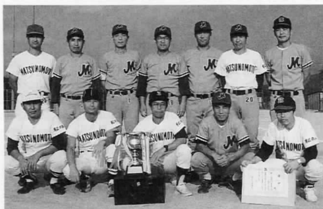
優勝の松の本チーム