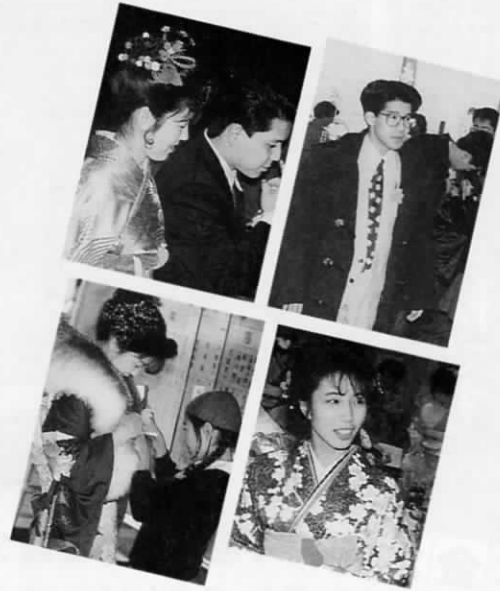
写真 は 去年の成人式スナップです