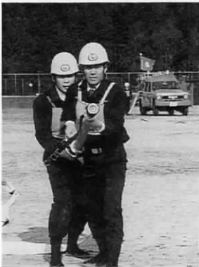
▲ポンプ操法を披露した団員