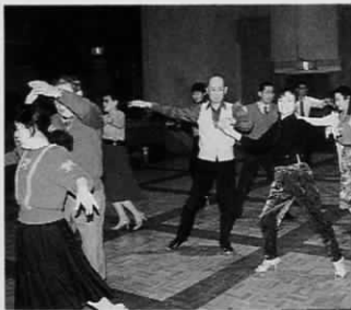
▼ホールでの練習風景

普段使わない筋肉を使うので体が引き締まり、女性は内面から美しさが出てくる。また男性は仕事帰りの人が多く、ストレスの解消につながるそうです。ワルツやタンゴなどのモダンならお年寄りの人にも無理なく楽しめ、いつまでも若さを保てます。年に1～2度、全教室の生徒さんたちを集めてのパーティーも開かれているそうです。和気あいあいとした雰囲気のなか友だちがたくさんできそうな素敵なサークルです。