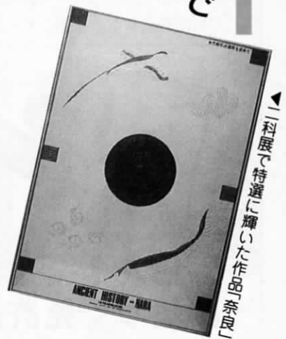
「二科展で特選に輝いた作品」奈良