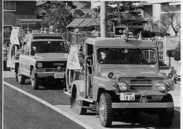
遠賀町消防団では、3月1日の午前9時から消防自動車による防火パレードを行い、住民の皆さんに「火の用心」を呼びかけます。