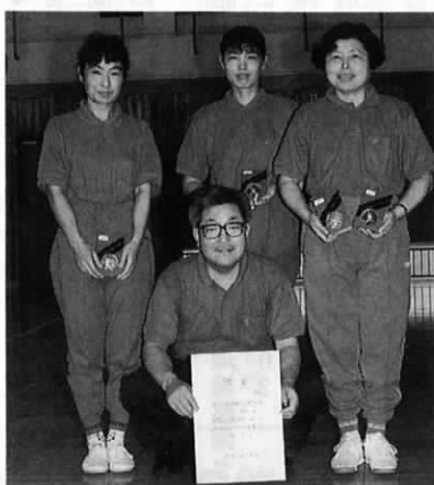
▲ 団体の部優勝 東和苑チーム