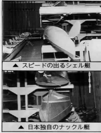
▲スピードの出るシェル艇 ▲日本独自のナックル艇

漕艇競技は一般的にはボートレースと言われますが、最近では、毎年6月に遠賀川漕艇場で開催される「九州朝日レガッタ」のようにレガッタが通称になってきています。また、日本漕艇協会が公認する競漕用艇は9種類。このうち国民体育大会には次の5種類の艇を使うのです。