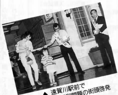
▲ 遠賀川駅前 同和問題の街頭啓発