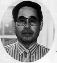
国民年金保険料 委託徴収員