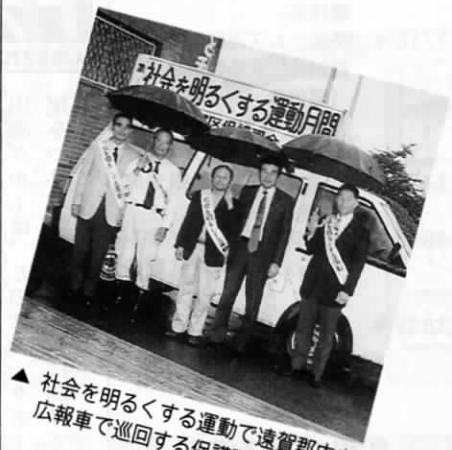
▲ 社会を明るくする運動で遠賀郡内を広報車で巡回する保護司会のみなさん