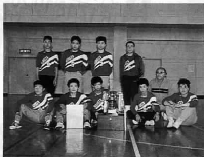
▲ Aクラス優勝 虫生津チーム