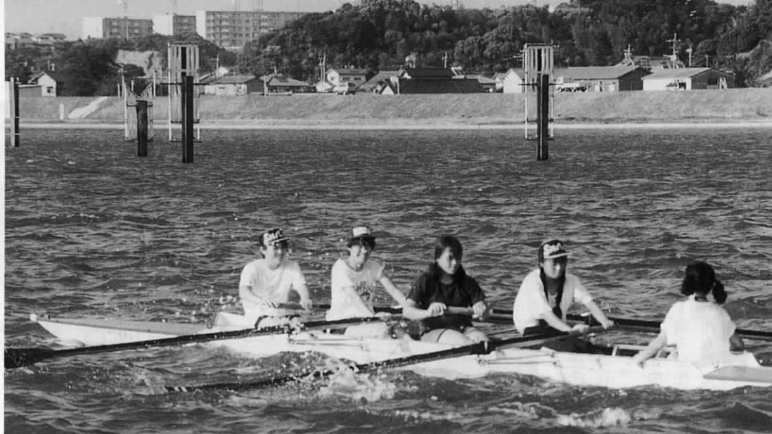
▲ 一日1400本のオールを漕ぎ猛練習する、遠賀高校女子クルー