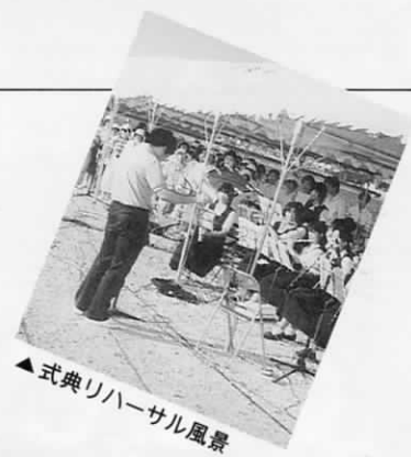
▲式典リハーサル風景