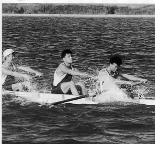
▲ 遠賀ローイングクラブの2人を含む福岡選抜チーム