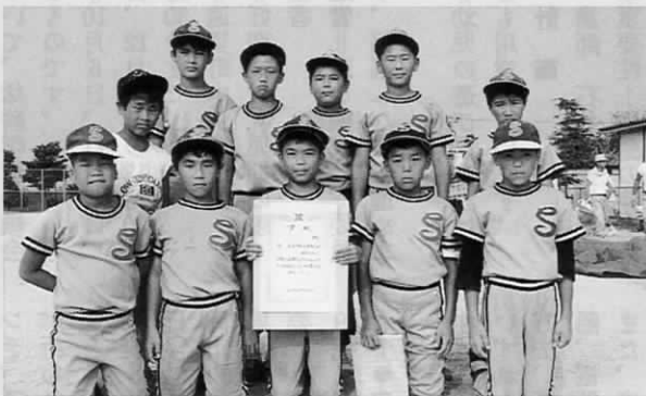
▲ 準優勝の新町チーム