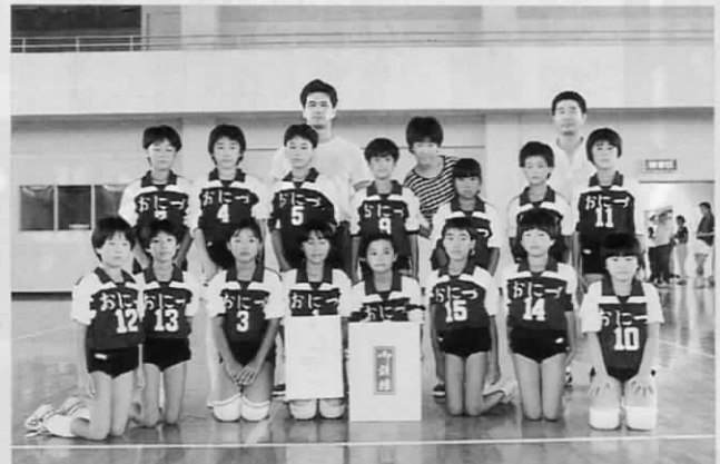
▲ 準優勝の鬼津チーム