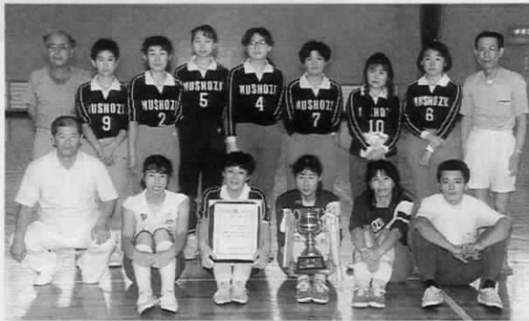
▲ Aクラス優勝 虫生津チーム

▷Aクラス 優勝 虫生津チーム 準優勝 松の本チーム ▷Bクラス 優勝 広渡チーム 準優勝 浅木チーム