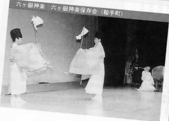
六ヶ嶽神楽 六ヶ嶽神楽保存会 (鞍手町)