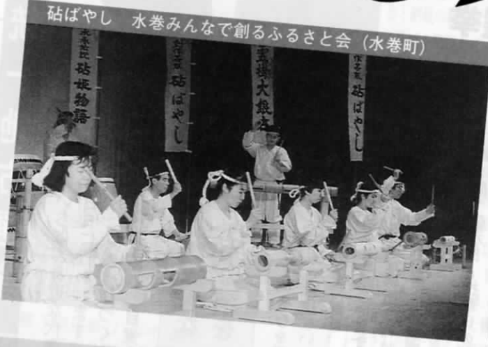
砧ばやし 水巻みんなで創るふるさと会 (水巻町)