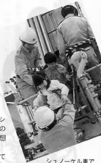
シュノーケル車で 地上15mの世界へ