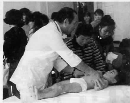
食生活改善推進教室 受講生募集