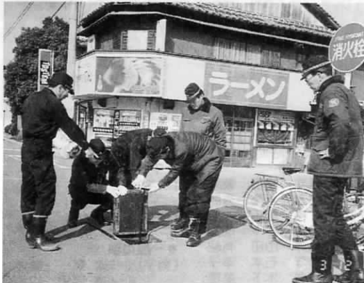
消防栓の点検を行う消防団員

この、私たちの生命、身体、財産を守るために活動する消防団は、各自の職業に従事しながら、火災や災害などの非常時に招集されて活動するボランティアなのです。 私たちも、他人まかせにすることなく自分たちの生命や財産は自分たちで守るという意識を高め消防団と共に火災や災害を防ぐ努力をしなければなりません。