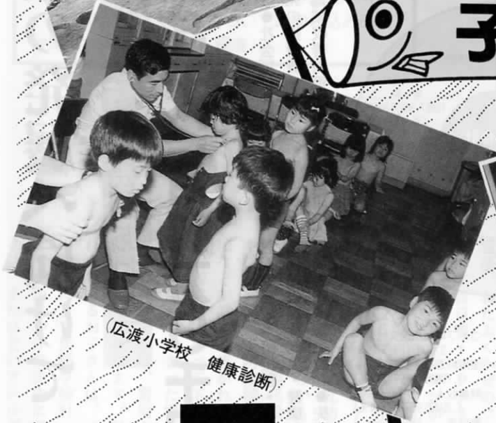
(広渡小学校 健康診断)