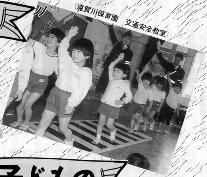
(遠賀川保育園 交通安全教室)