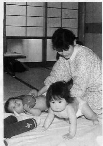
4月11日 乳児相談 中央公民館にて

医学の進歩した現在でも、赤ちゃんの百日咳や破傷風はこわい病気ですし、ハンカも脳炎や肺炎などの合併症を起こすことがあります。また風疹は、妊娠早期にかかると赤ちゃんに奇形を起こすため、とくに女性の場合、結婚前にワクチンを受けておくと安心です。子供の健康のため、体調の良い時に早めに予防接種を済ませておきましょう。