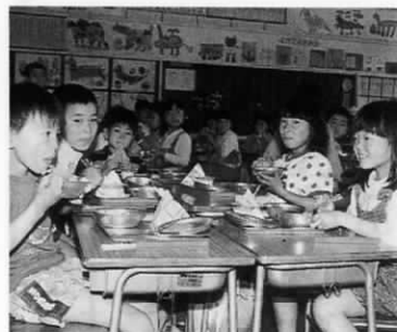
4月21日 島門小学校給食風景