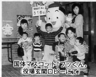
国体マスコット「フックン」 (役場玄関ロビーにて)

自ら考え自ら実践する地域づくり事業として一律一億円が地方交付税に算入されますが、この使途については、各方面から幅広い意見を拝聴し、未来につながる計画をたてて具体化していきたいと考えています。