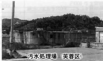
汚水処理場 (芙蓉区)

遠賀総合運動公園もほぼ完成しましたので、この公園施設をより多くの皆様に利用・活用していただき、スポーツの振興、健康づくり、コミュニティの育成などの施策を進めてまいります。