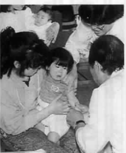
4月11日 ツベルクリン反応検査 中央公民館にて