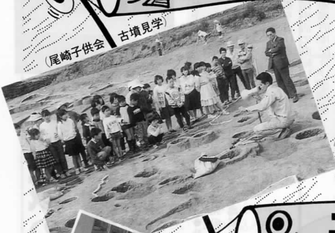
(尾崎子供会 古墳見学)