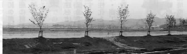
グラウンド、テニスコート、ゲートボール、サッカー、相撲場使用料金表

4月1日より次のとおり、施設拡充とあわせて使用料の改正を行いました。町民の皆様のスポーツや文化活動の場として、より一層のご活用をお願いいたします。