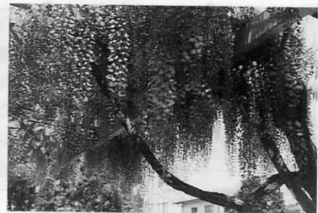
児童公園のふじ (芙蓉)