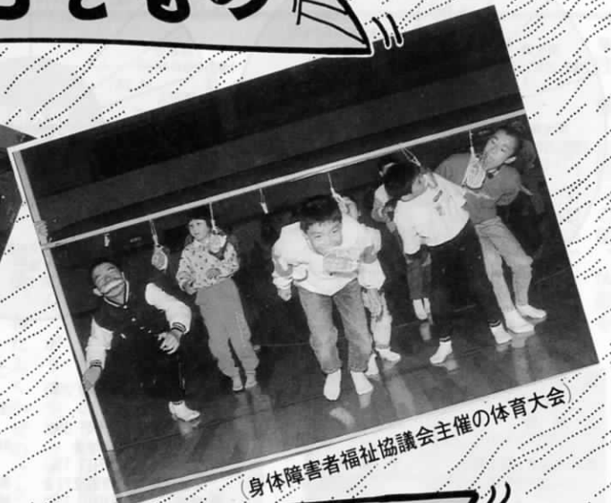
(身体障害者福祉協議会主催の体育大会)