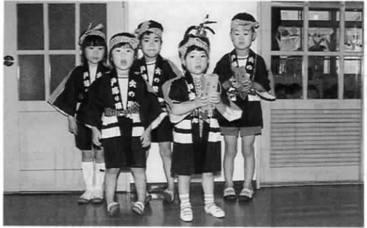
遠賀川保育園幼年消防団