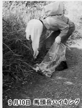
9月10日 馬頭岳ハイキング