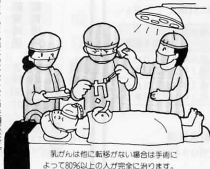
乳がんは他に転移がない場合は手術によって80%以上の人が完全に治ります。

乳がんは最近非常に増えてきており、近い将来女性がかかるがんのトップになるだろうと言われていますが、その一方非常に治療成績のよいがんなので、小さいうちに発見して手術すれば生命の危険は避けられます。 「自分はもう更年期を過ぎたから乳がんにならない」とか、反対に「乳がんはお婆さんのかかるも