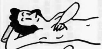
①あおむけに寝て指の腹で乳房をなでなでしてしこりを調べます。 ②右の要領で、乳房の外側から内側へ、内側から外側へと調べます。