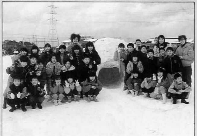
▲作った「かまくら」の前で記念写真ハイポーズ