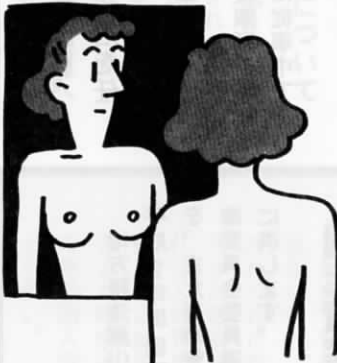
乳がんの早期発見には、定期的な自己検診が大切です。