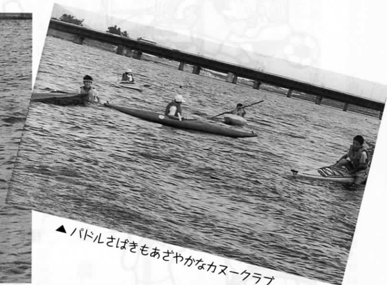
▲パドルさばきもあざやかなカヌークラブ