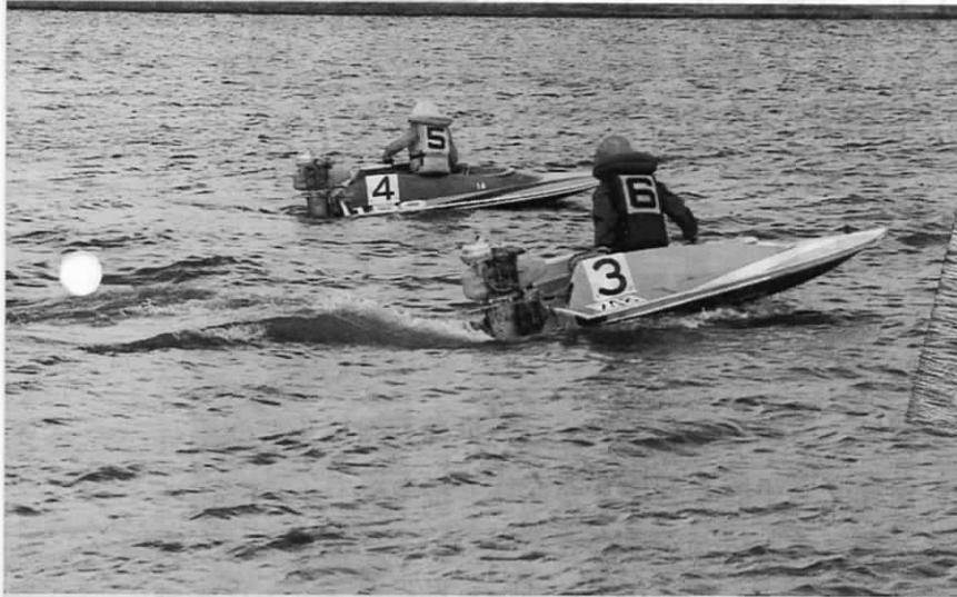
▲スピードとスリルのアマチュア・モーターボート