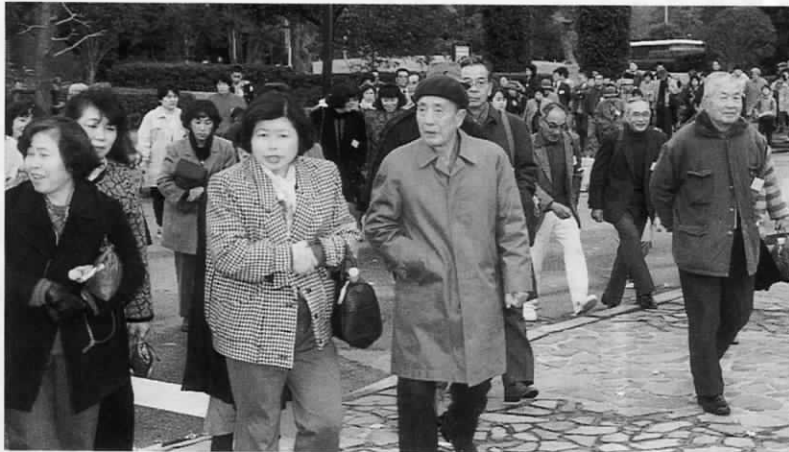
福岡市美術館前にて

これからも、美術・音楽・演劇など多くの分野の芸術・文化に接することができるようツアーを予定しています。どうぞお楽しみに。