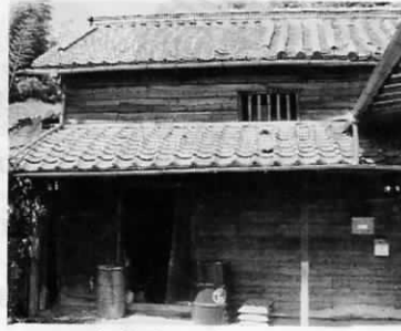
望東尼のかくれた物置

「福岡県の歴史」に次のように書かれている。――勤王佐幕の間を藩論が揺れ動いていた幕末の福岡藩は、一八