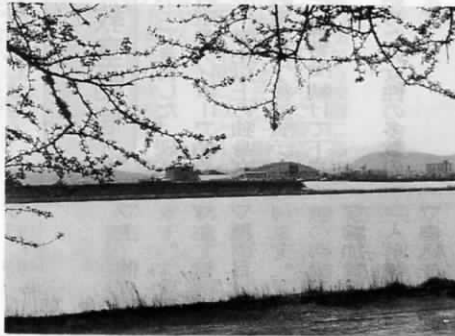
館屋敷から遠賀をのぞむ

この章をよく読んで見ると、その通過した道がよく解らない。そこでささい。そこからゆるゆると、若松から江川を通り遠賀川に出で、木屋瀬へ逆行した。とも思えるのである。若松から黒崎へ上り陸路を、今の道のように木屋瀬へ出たのだ。たら、全く何の説明もないことが不審な気がする。やはり船上を遠賀川を上ったため、変化がなく、記事にもならなかったであろう。