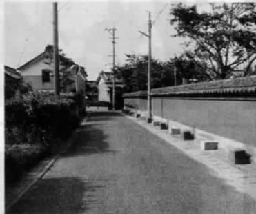
浅木の道 (片山花御史)

初夏のある日、底井野から昔の道を通ることにする。底井野の集落を出れば、たあたりの広々とした道を北に遠賀の方に歩く。うしろには六ヶ嶽が夏雲の中にかげ、近くの田圃は田植のさ中で、ところどころにはトラクターの赤い胸が見える。