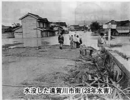
水没した遠賀川市街(28年水害)