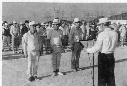
▲ 総合優勝は広渡区が