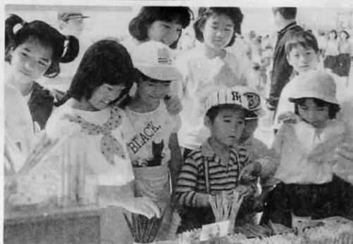
▲ 出店には子どもたちの列が