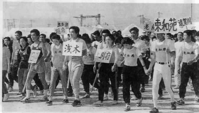
▲ 手をつないで入場 (夫婦リレー)