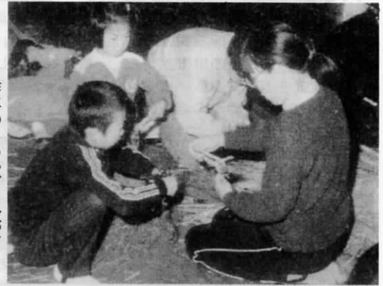
▶ 昨年のしめかざり教室