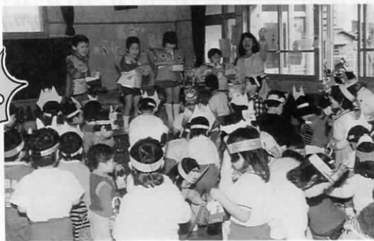
— 遠賀川保育園にて —