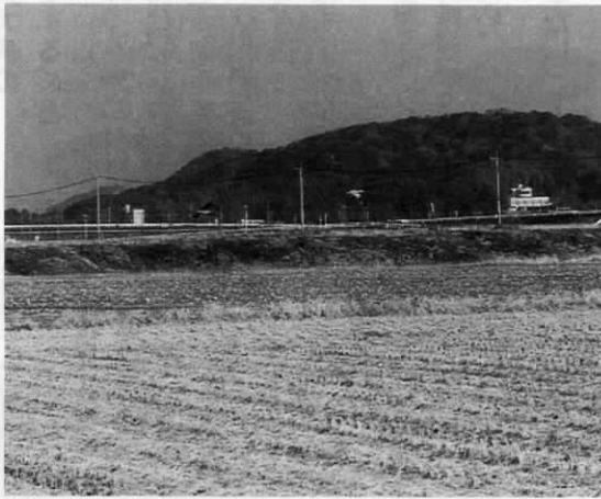
木守田圃、水巻方面を望む