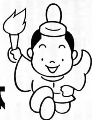
マスコット「フックン」